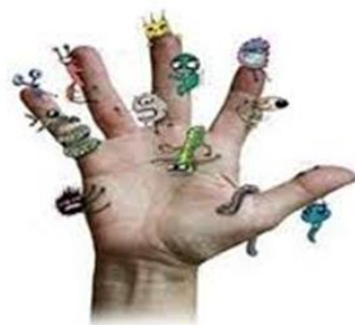
Perché bisogna lavarsi le mani spesso?

In ospedale le mani sono il veicolo più comune attraverso il quale si trasmettono i microrganismi responsabili di infezioni.