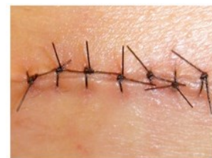
Ferita in fase di guarigione

Di seguito è riportata un'immagine che fa bene intendere la differenza tra una ferita in via di guarigione e una ferita da tenere sotto controllo.