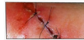
Ferita da controllare

Nonostante l'evidente distinzione tra le due ferite, è importante sapere che tali differenze non sono sempre così nette.